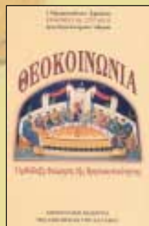
ΘΕΟΚΟΙΝΩΝΙΑ - ΟΡΘΟΔΟΞΗ ΘΕΩΡΗΣΗ ΤΗΣ ΘΡΗΣΚΕΥΤΙΚΟΤΗΤΑΣ Μητροπολίτου Άγγελου Εύθυμιού Σελ. 215, σχήμα 14Χ21 Τιμή: 9 €