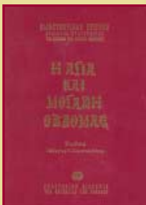
σχήμα 17Χ24 (δεμένο), σελίδες 485, τιμή 40 € (συνοδεύεται ἀπὸ δύο cd's)

– παρασημάνσεως τῶν ρυθμικῶν μέτρων (ἐκτός ἀπὸ τὰ σημεῖα ἐκεῖνα πού ἡ χρονικὴ ἀγωγή θέλει χρόνον οὐσιαστικᾶ ἐλεύθερο),