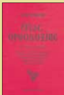
ΕΡΩΣ ΟΡΘΟΔΟΞΙΑΣ (ΕΠΙΑΝΕΚΔΟΣΗ) του Παντελή Πάσχου Σελ. 622, σχήμα 14Χ21 Τιμή: 13 €