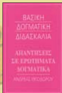
«ΑΠΑΝΤΗΣΕΙΣ ΣΕ ΕΡΩΤΗΜΑΤΑ ΔΟΓΜΑΤΙΚΑ» ΕΠΙΑΝΕΚΔΟΣΗ Άνδρέα Θεοδώρου (†), Όμοτ. Καθ. του Πανεπιστημίου Άθηνων Σελ. 264, σχήμα 14Χ21 Τιμή 13 €