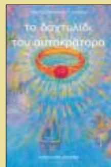
ΤΟ ΔΑΧΤΥΛΙΔΙ ΤΟΥ ΑΥΤΟΚΡΑΤΟΡΑ της Γαλάτειας Γρηγοριάδου-Σουρέλη (συνοδεύεται από cd) Σελ. 136, σχήμα 20Χ25 Τιμή 17 €