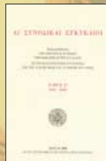
ΑΙ ΣΥΝΑΔΙΚΑΙ ΕΓΚΥΚΛΙΑΙ (ΤΟΜΟΣ Ζ') (1996-2000) Υπό της Ίερας Συνόδου της Έκκλησίας της Ελλάδος Σελ. 232, σχήμα 17Χ24 Τιμή: 10 €