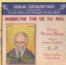
ΚΑΝΩΝ ΠΑΡΑΚΛΗΤΙΚΟΣ ΕΙΣ ΤΟΝ ΟΣΙΟΝ ΚΑΙ ΘΕΟΦΟΡΟΝ ΠΑΤΕΡΑ ΗΜΩΝ ΑΘΑΝΑΣΙΟΝ ΤΟΝ ΕΝ Τῷ ΑῶΦ C D-ROM Τιμή: 12 € (Κεντρική διάθεση)