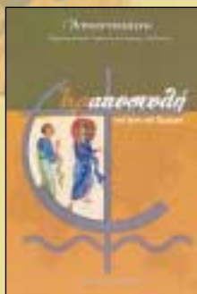
ΓΕΡΑΠΟΣΤΟΛΗ ΣΤΑ ΙΧΝΗ ΤΟΥ ΧΡΙΣΤΟΥ Άναστασίου, Αρχιεπισκόπου Τυράνων και πάσης Άλβανίας Σελ. 374, σχήμα 17Χ24 Τιμή: 17 €